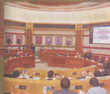
■浸大師生、嘉賓與各界人士出席頒獎典禮暨得獎學人講座。