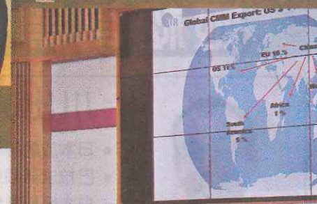
■法蘭茲教授於頒獎典禮後以「中醫藥國際化——全球性挑戰」為題演講。