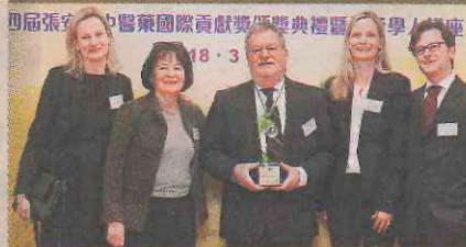
■法蘭茲教授的太太及子女從德國和英國來香港支持。